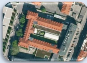
Digitales Orthophoto (DOP) für den Blick von oben (aktuell und historisch)